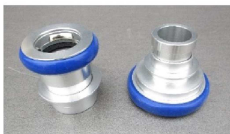
※ 媒介金具 50A用 2個